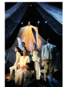
სირანო დე ბერჟერაკი